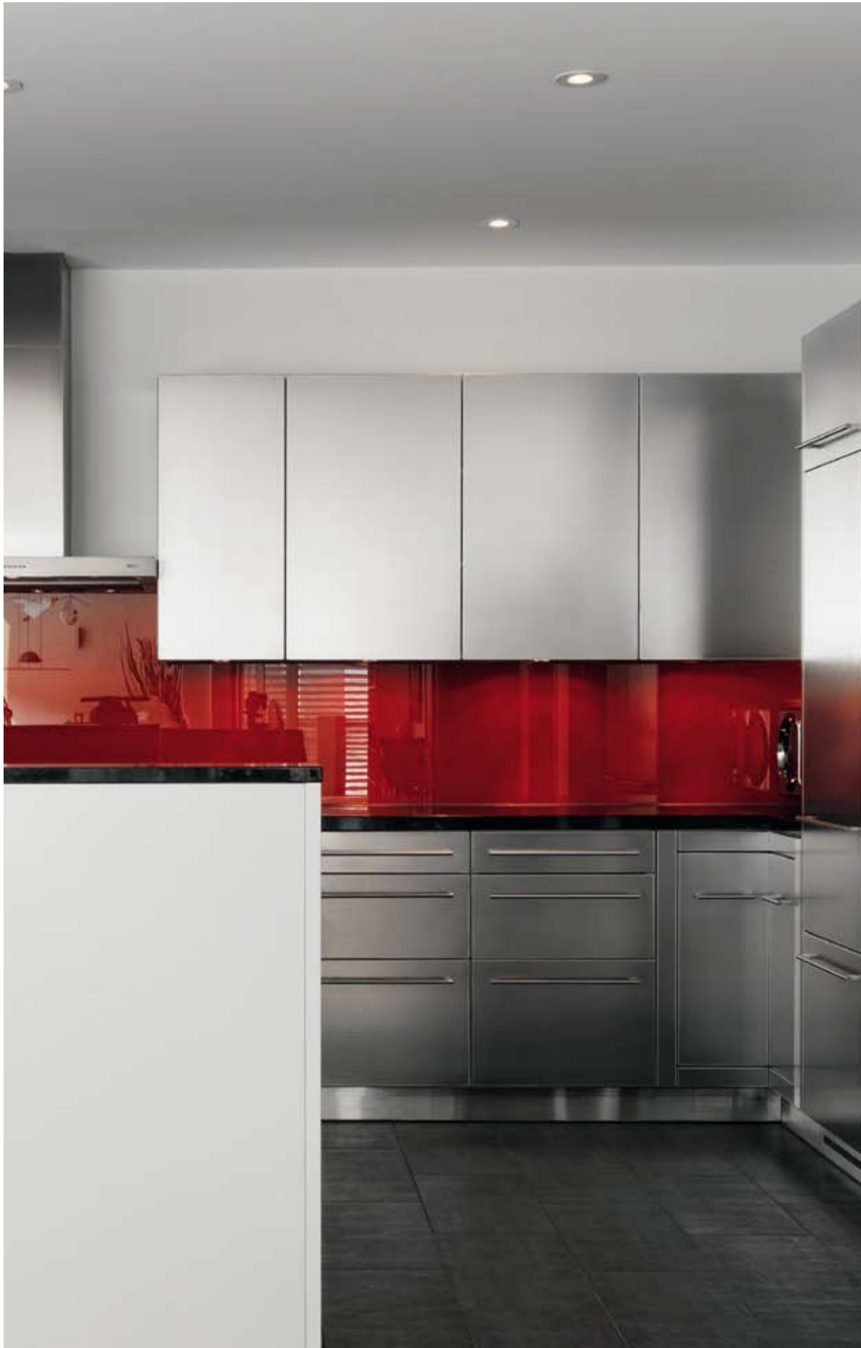
Un pannello rosso in vetro disposto lungo tutta la parete posteriore, fa brillare elegantemente le superfici in acciaio inossidabile.