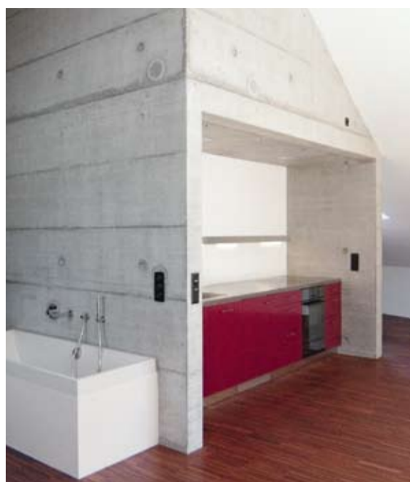
Il cuore dell'appartamento «Open Space» è la cucina lineare di colore rosso fuoco di Forster.