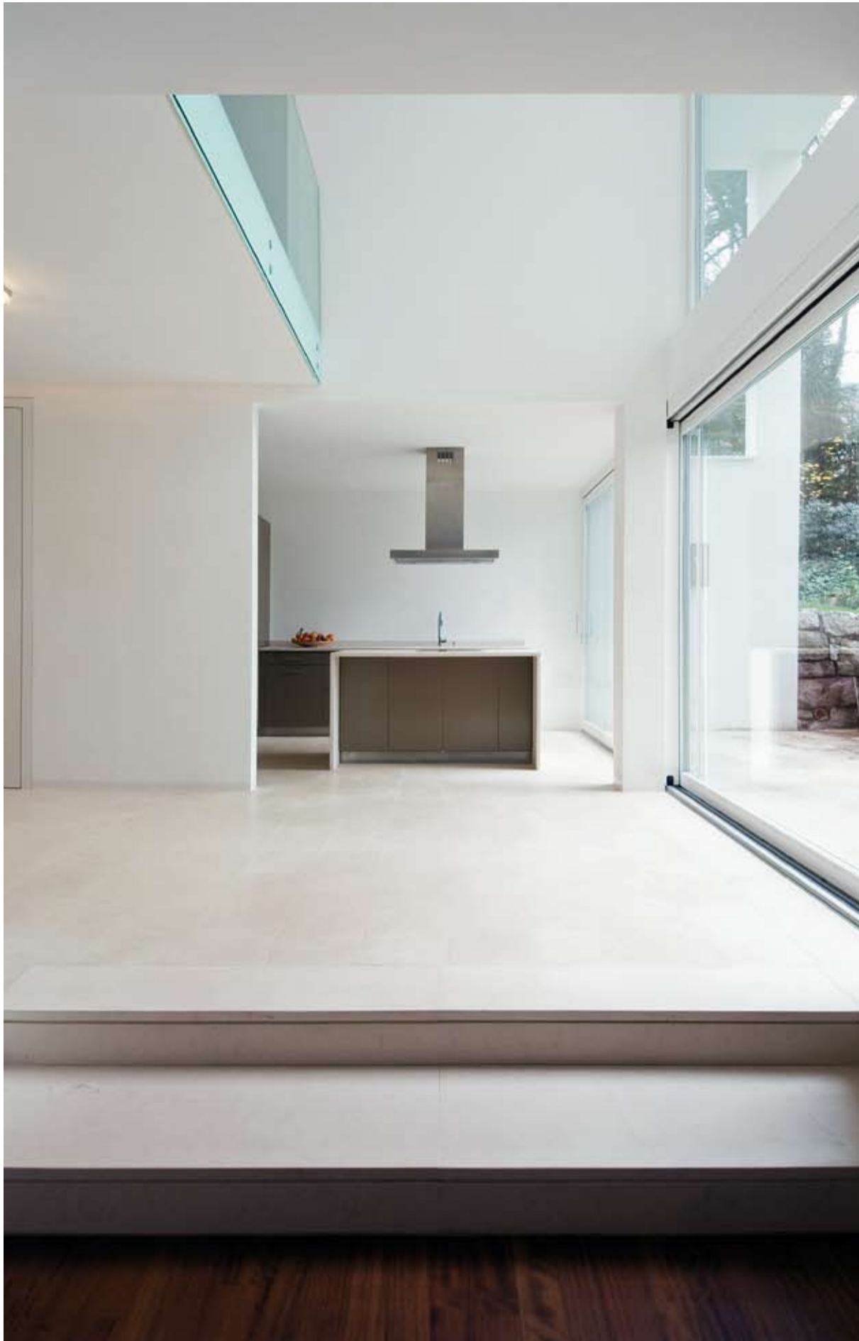
Apertura e trasparenza: grazie alle finestre alte fino al soffitto verso il giardino, la cucina risplende di grande luminosità.