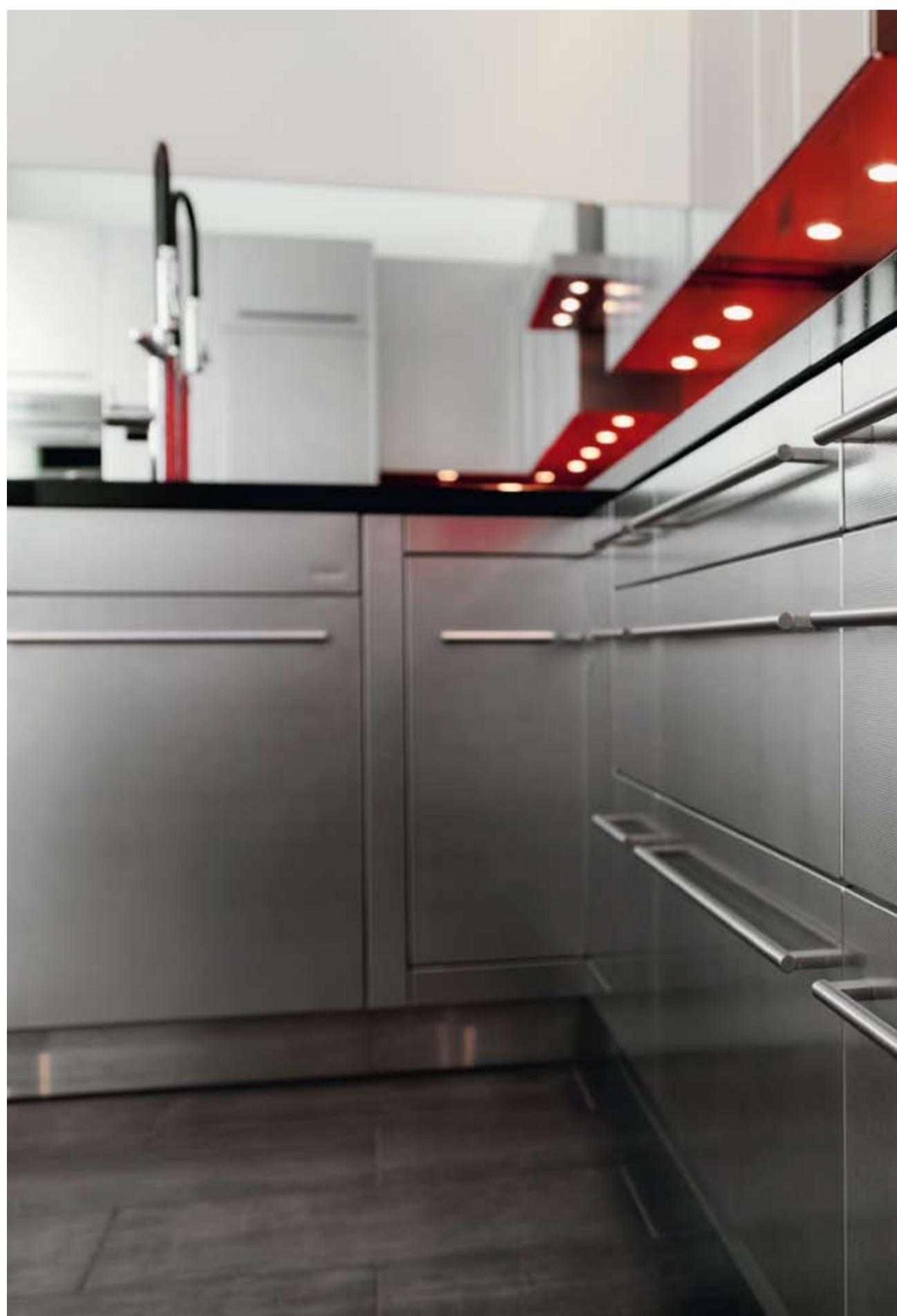
La superficie «Inox Line» di Forster è leggermente strutturata e conferisce all'acciaio inossidabile un intenso effetto estetico.